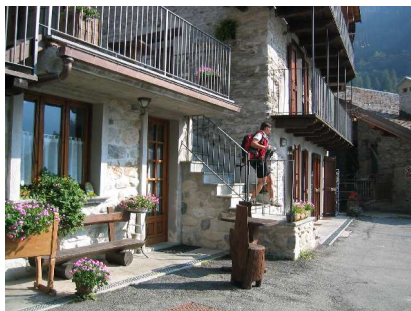
Posto tappa in Vernetti

Nach Sockenwechsel und Grobreinigung meiner Hose geht es schließlich wieder weiter. Je tiefer wir kommen, umso steiler und auch mit Brennesseln durchsetzter werden die Wiesen. Die Schiebepassagen nehmen beständig zu. Die letzten 50 Höhenmeter hinunter zum kleinen Weiler Laurenti kämpfen wir uns schließlich mit unseren kurzen Hosen fluchend durch ein dichtes Gestrüpp, das ausschließlich aus Pflanzen besteht, die stechen, kratzen oder jucken. Laut unserer Karte sollte direkt durch Laurenti eine Variante des GTA weiter talabwärts verlaufen. Wegmarkierungen entdecken wir keine und auch der Versuch, einen Weg zu finden endet in einem großen Brennesselverhau. Wir geben endgültig auf und versuchen auf dem Forstweg nach Elva zu fahren. Leider ist dazu auch wieder ein ordentlicher Gegenanstieg zu nehmen. Bis wir in Elva sind, haben wir fast zwei Stunden sinnlos mit der Suche nach geeigneten Wegen und der Reinigung meiner Hose verbracht. Ab hier benutzen wir nur noch die landschaftlich äußerst beeindruckende Straße durch die Elvaschlucht. Ständige Tiefblicke wechseln mit kurzen Tunnels und Ausblicken auf felsige Gipfel. Selbst die Straße allein ist in ihrer Routenführung bereits eine Sehenswürdigkeit. An der Einmündung ins Maira-Tal treffen wir auf einen einzelnen Motorradfahrer, der ebenfalls aus Augsburg kommt. Nach einer kurzen Unterhaltung geht es taleinwärts entlang der Maira bis zum Abzweig des Marmora-Tals.