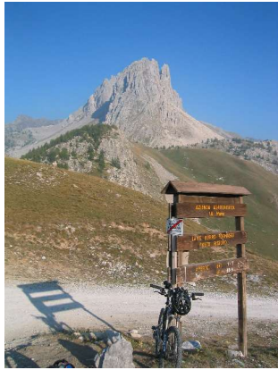
La Meja vom Colle del Preit

Kurzerhand quartieren wir uns im posto tappa in Vernetto ein. Statt eines Zimmers bekommen wir gleich eine komplette und gut ausgestattete Ferienwohnung und genehmigen uns im kleinen Biergarten anschließend eine Kaffeepause.