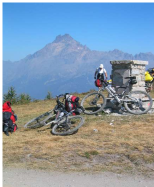
Colle Bicocca mit Monte Viso

Eigentlich wollten wir direkt vom Pass auf der Straße hinunter nach Elva und weiter über die Elvaschlucht in das Maira-Tal. Angesichts des schönen Wetters beschließen wir jedoch, auf der Höhe zu bleiben und Richtung Westen bis zum Colle Bicocca zu fahren. Von dort soll eine Trailabfahrt ins Tal führen.